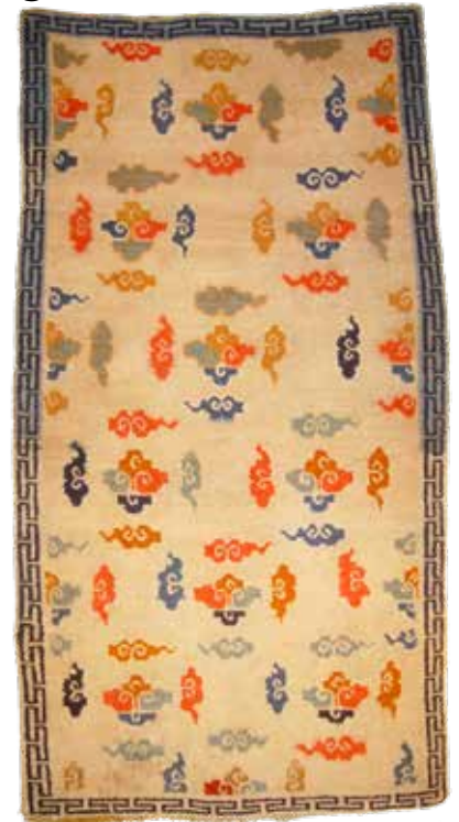
Shigatse antik 79 x 147 4.500.–