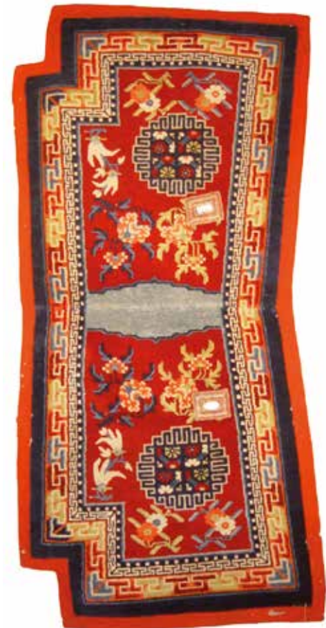
Gyantse-Satteldecke antik 71 x 149 4.500.-