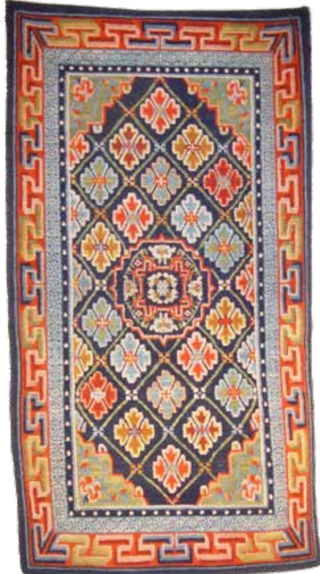
Shigatse antik 80 x 148 4.300.–

Öffnungszeiten: tägl. 9 bis 18.30 Uhr Sa. 9 bis 14 Uhr, langer Sa. bis 16 Uhr