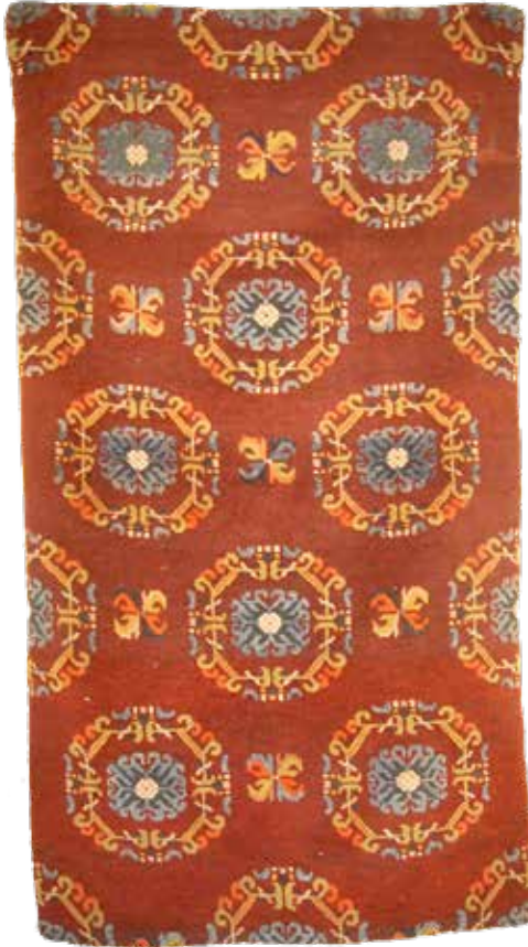
Shigatse antik 85 x 156 3.940.–