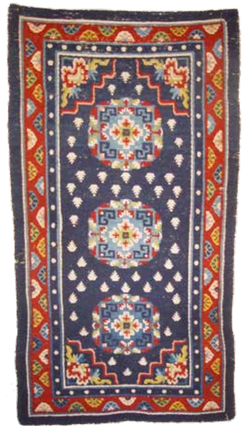
Shigatse antik 73 x 133 3.940.–

Die eingeknüpften Muster dokumentieren in einzigartiger Weise den tibetanischen Musterschatz. Etliche Teppiche beinhalten Drachen-Motive (Symbol für Kraft und Güte). Diese waren früher den tibetanischen Königen und später dem Dalai Lama und der Adelschicht vorbehalten. Sie stehen symbolisch für Macht und Herrschaft. Weitere Muster sind Phönixe (Symbol für Wohlwollen und Güte), Fledermäuse (Symbol für Fruchtbarkeit), Perlen (Symbol für Reichtum), Lotusblüten (Symbol für Heiligkeit und Reinheit), Päonien (Symbol für Frühling), Wolkenbänder (Symbol für regenspendende Kraft), die Swastika (nachweislich 5.000 Jahre alt) und viele weitere tibetanische Motive.