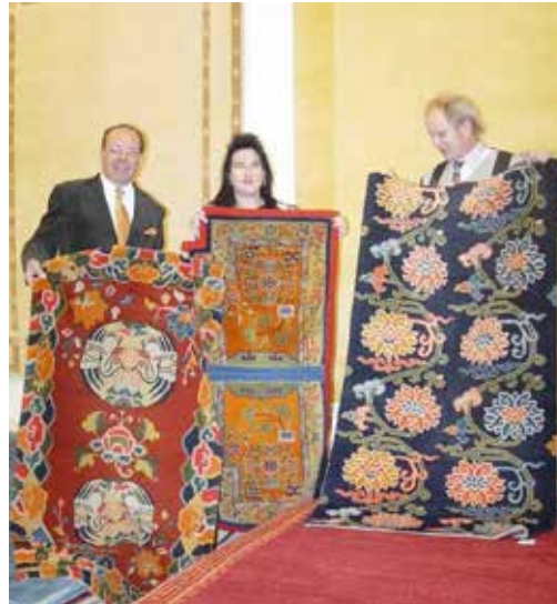
Lhasa antik 80 x 134 4.500.-