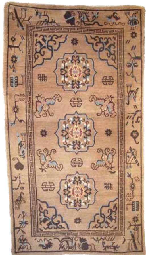
Shigatse antik 87 x 159 4.500.-